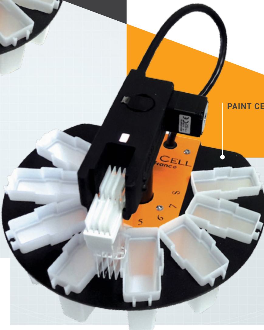
PAINT CELL 10

par tablette tactile, logiciel PaintCell intégré permettant de créer des colorations de façon intuitive. Aucune formation nécessaire. 150 colorations enregistrables.