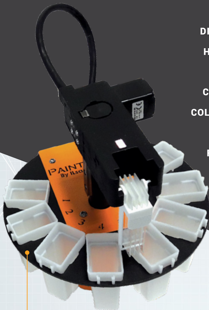
PAINT CELL 4

DIAMÈTRE HAUTEUR POIDS CAPACITÉ COLORANTS